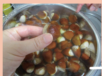
①一晩水につけて虫だし