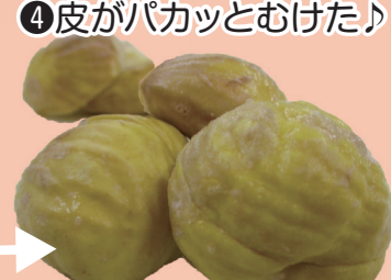
④皮がパカッとむけた!