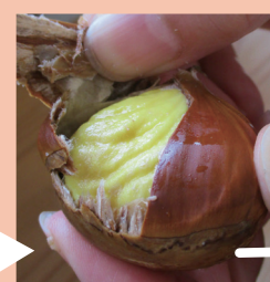
③自然解凍して皮をむくと…