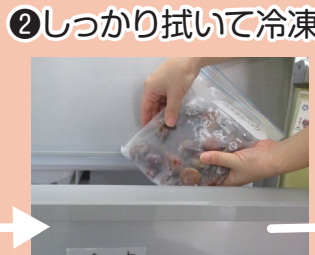
②しっかり拭いて冷凍