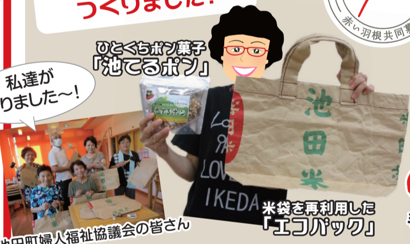
池田町婦人福祉協議会の皆さん

売上げの一部が赤羽根共同募金に寄付されます☆こってコテいけだにて販売してまーす!